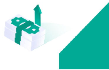
تمويل شخصي بدون تحويل راتب

برنامج التمويل التعليمي من بنك الرياض يمكنك من تقسيط رسوم التعليم بدون هامش ربح.