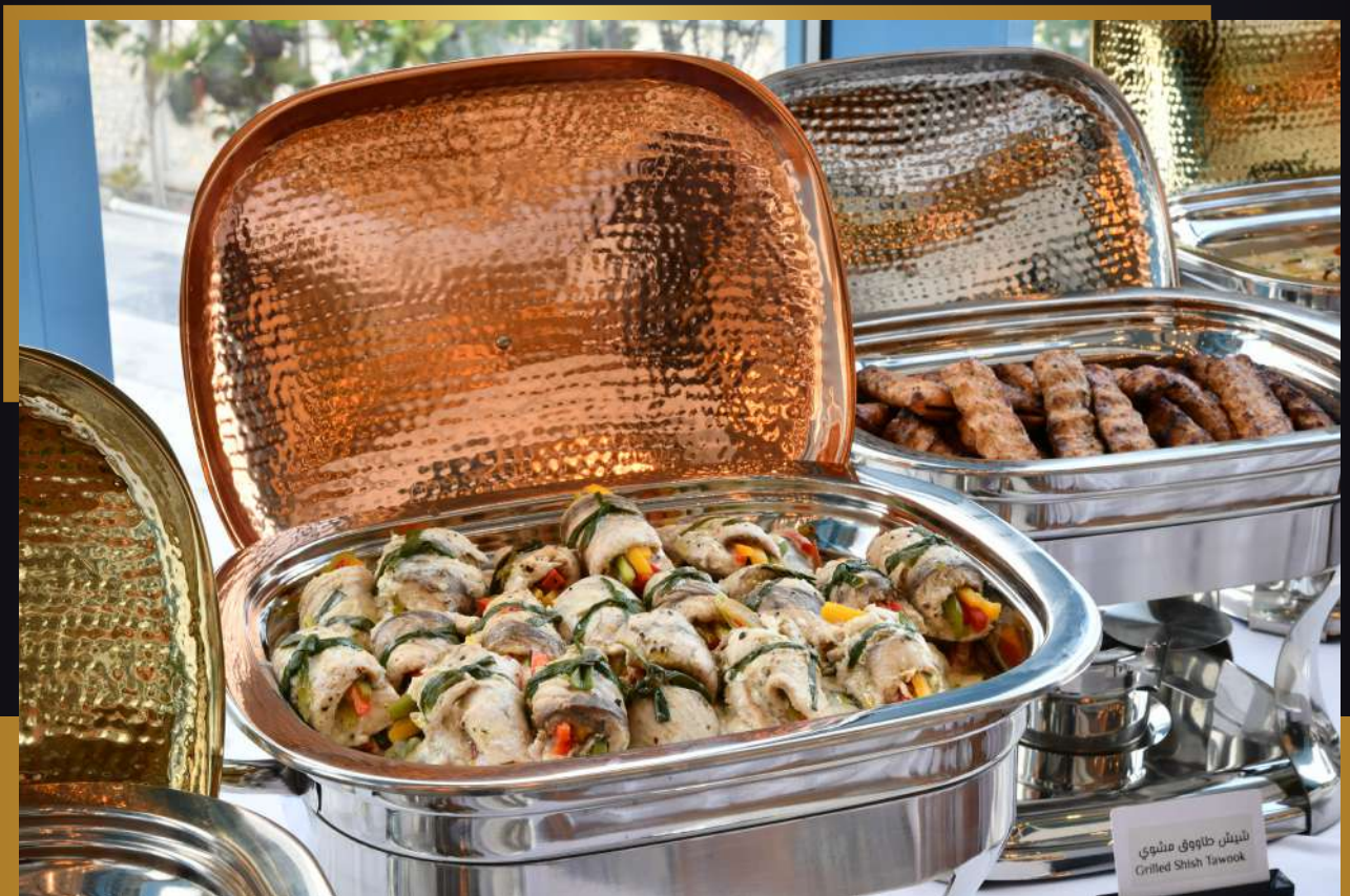
شيش طاووق مشوي Grilled Shish Tawook